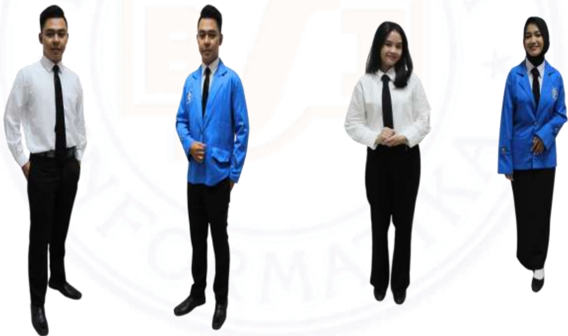
Gambar 2. Ketentuan Pakaian dan Atribut ORMIK