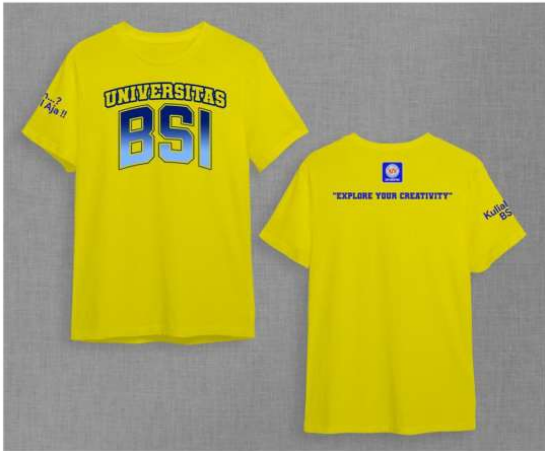
Gambar 6. Desain Kaos NIM Digit Terakhir Genap