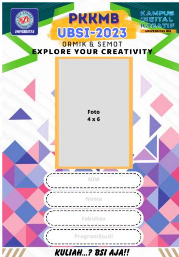
Gambar 3. Desain Name Tag

Desain Name Tag dapat di unduh pada tautan https://bit.ly/ormik_tagasal2324