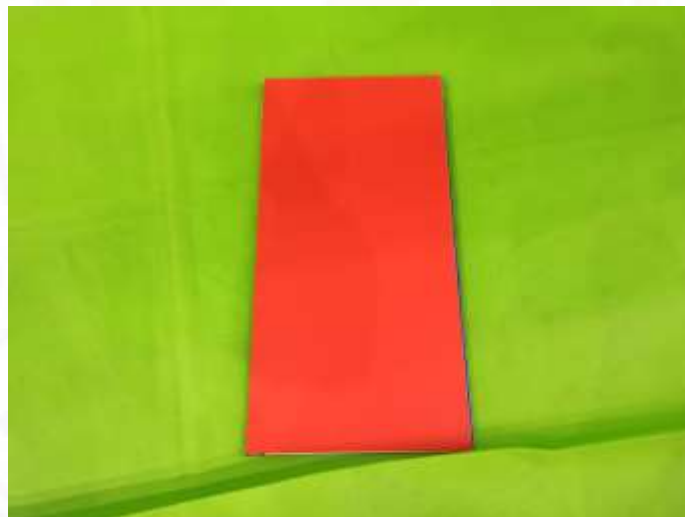
Gambar 9. Paper Mob Saat Dilipat