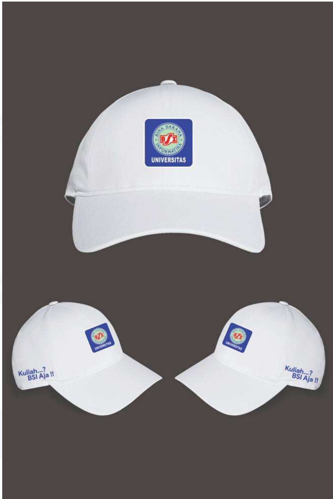
Gambar 5. Desain Topi NIM Digit Terakhir Ganjil