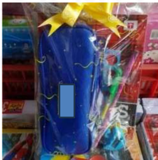
Gambar 1. Paket Alat Tulis