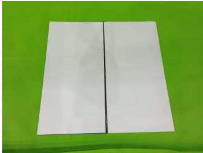
Gambar 8. Paper Mob Tampak Sisi Bagian Warna Putih