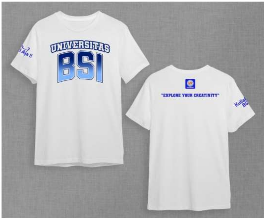
Gambar 4. Desain Kaos NIM Digit Terakhir Ganjil