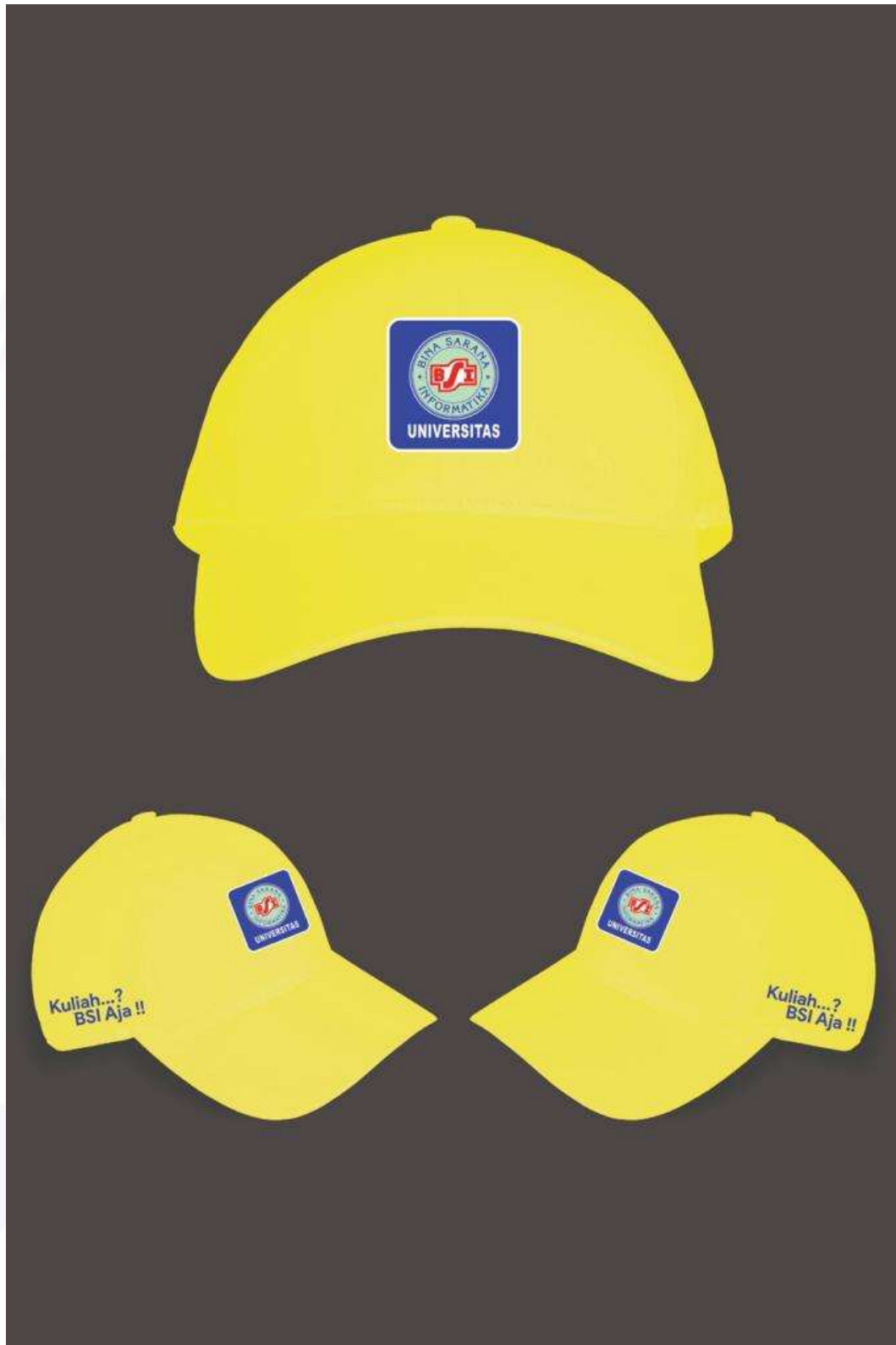
Gambar 7. Desain Topi NIM Digi Terakhir Genap